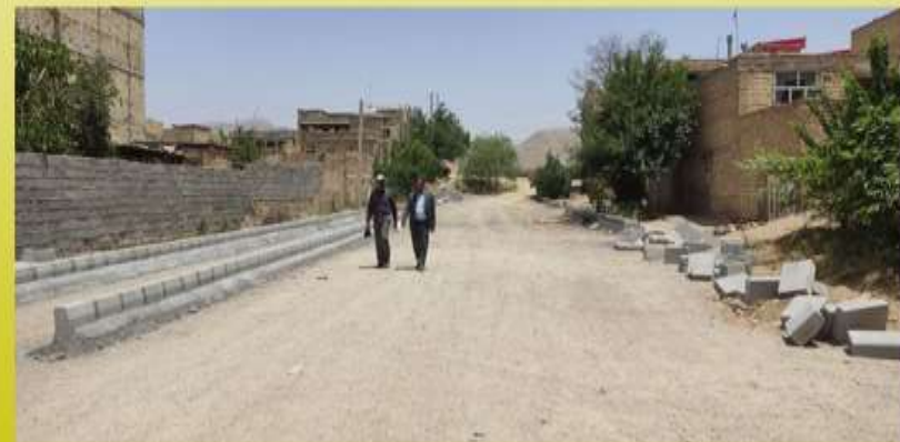
جدول گذاری و زیر سازی خیابان و نیچه محله پلاکها