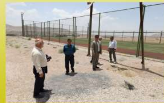
احداث زمین چمن مصنوعی نکوآباد