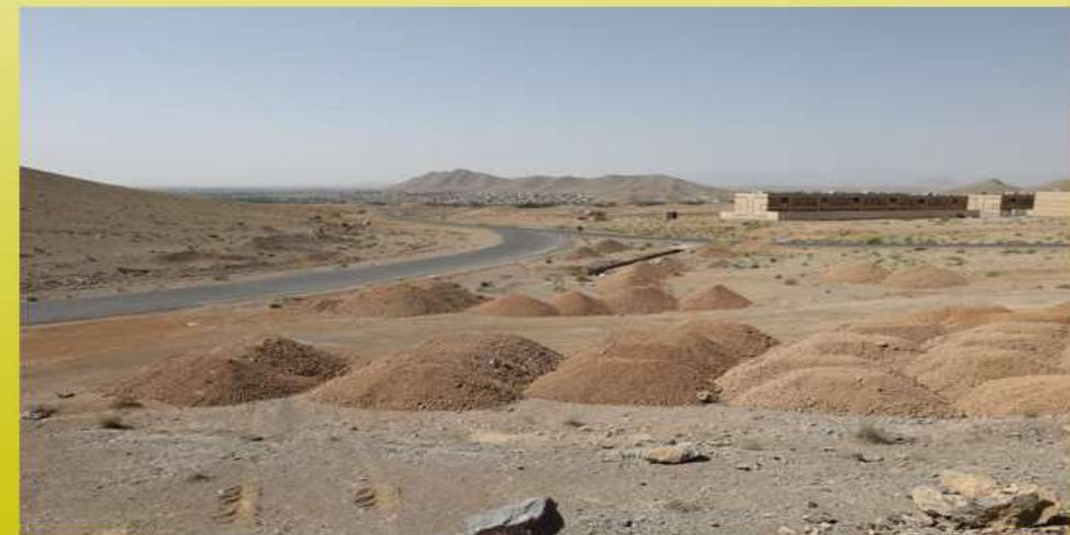
کوه بری و خاک ریزی لاین دوم مسکن مهر تا وینیچه