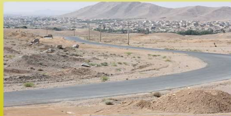
نخاله برداری لاین دوم از میدان امام حسین تا سه راهی مسکن مهر