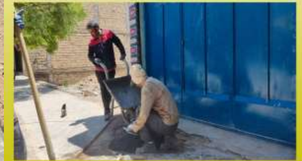
بلوک فرش پیاده رو های سطح شهر