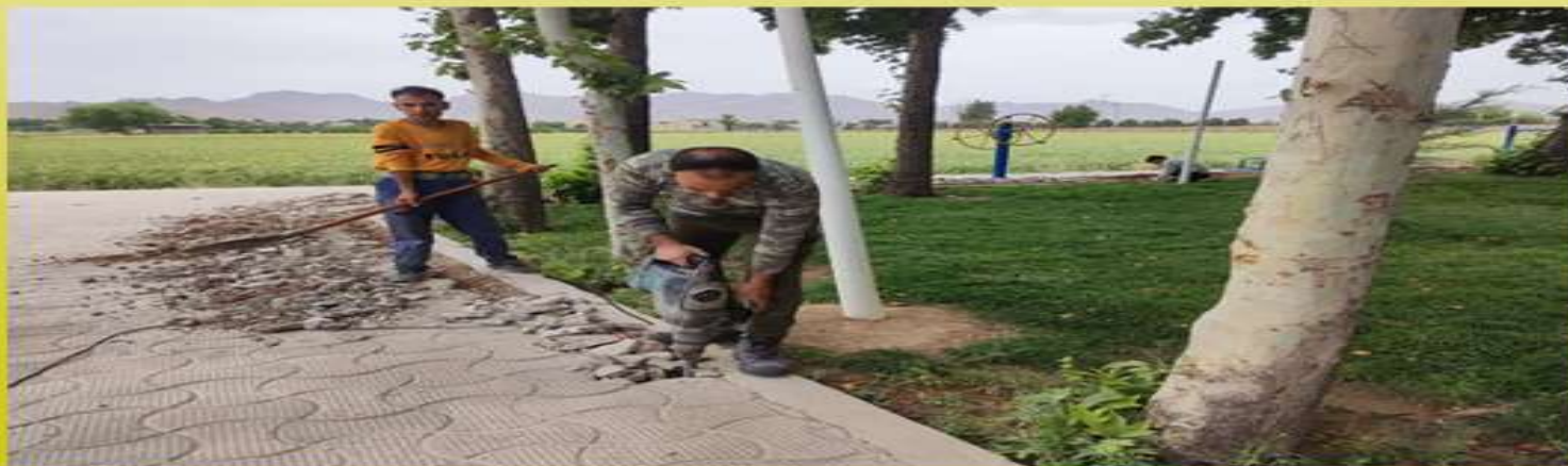
کابل کشی و نصب روشنایی پارک دیزیچه سلامت