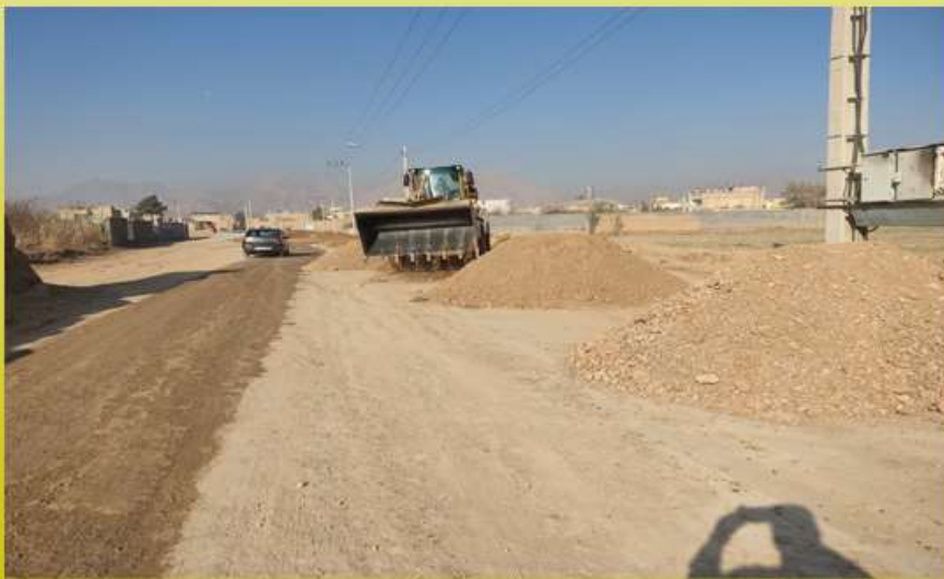
خاک ریزی و زیرسازی خیابان امامت